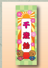
『木魚のぽっくん』 オリジナル風船